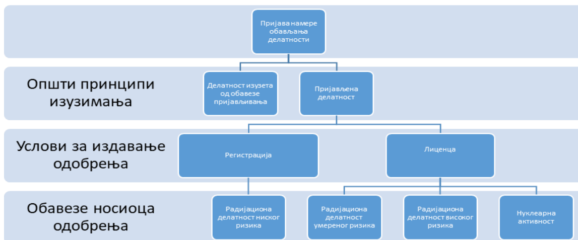
Слика 2. Шема поступка одобравања делатности

Сврха извештаја о сигурности је да покаже да је делатност сигурна односно да се обавља на начин који гарантује да излагање изложених радника и становништва буде унутар прописаних граница. При анализи сигурности узимају се у обзир сви путеви излагања и сви извори зрачења који се користе при обављању делатности као и њихова међузависност.